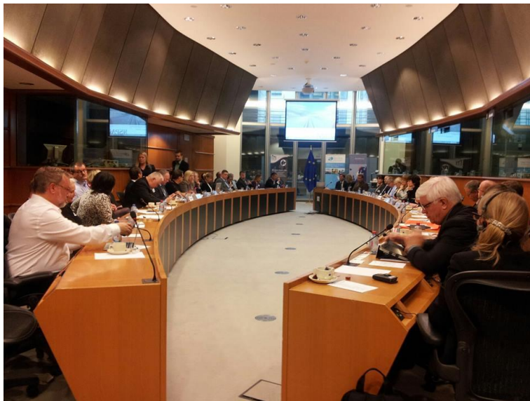
Seminarium i Europaparlamentet den 19 november om transportinfrastruktur i det Europeiska Arktis anordnat av North Sweden tillsammans med nätverket för NSPA.

Företrädare från EU-kommissionen, regionens näringsliv och nationella myndigheter i Sverige, Finland och Norge inför regionala aktörer och inbjudna från Europaparlamentet om vikten av satsningar enligt transportplanen för det Barents-Arktiska området (BEATA) i Europas nordliga delar för tillväxt för hela Europa och EU, med Europaparlamentariker Jens Nilsson och Henna Virkkunen som värdar.