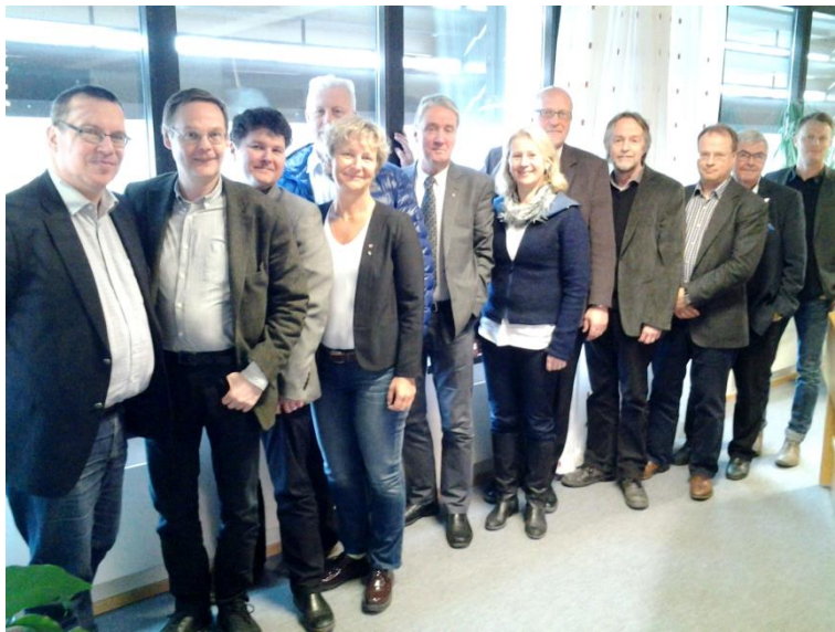
Ett samlat Ägarråd den 31 mars på Scandic i Skellefteå.

Under respektive processområde återges inom markerad ruta den huvudinriktning som slagits fast i verksamhetsdirektivet för 2014 samt den inriktning och målsättningar som i sin tur ställts upp i verksamhetsplanen för 2014. Redovisningen utgår ifrån de uppställda målen/huvudpunkterna under respektive rubrik i verksamhetsplanen och det är utifrån det genomförandet i form av aktiviteter och en redovisning av uppnådda mål relateras.